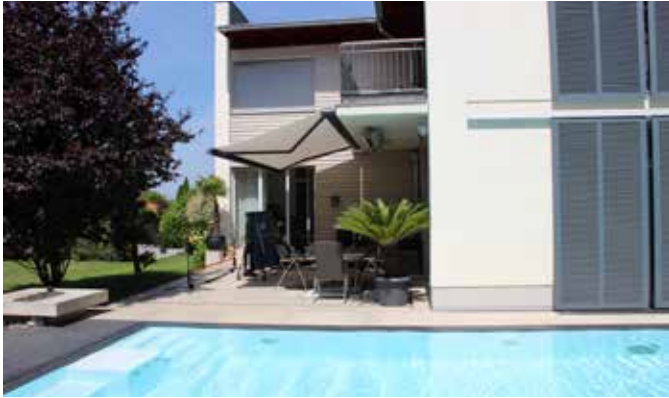
Das Schwimmbecken verfügt über die S-Line-Treppenanlage mit einem Startblock in der Mitte und integrierter Gegenstromanlage sowie einer Einstiegstreppe auf der einen und der Sitzbank mit Sprudeldüsen auf der anderen Seite.

So auch bei dieser Anlage. „Ein unspektakuläres Projekt“, erinnert sich Olaf Wendler, Geschäftsführer von Vario Pool System. „Transport und Einbringung liefen professionell ab. Da es sich um ein Rinnenbecken handelt, musste die Poolanlage genau ausnivelliert werden, was auch gut gelang.“ Nach Einbringung wurde das Becken mit einer Thermotec-Hinterfüllung versehen, die auch eine wärmedämmende Funktion hat. Um einen harmonischen Übergang von der Rinne zu den Umgangsplatten hinzubekommen, wurde der Rinnenrost ein Stück höher gelegt und dann mit Natursteinplatten bedeckt, so dass kein Bruch zwischen Rinne und Umgangsplatten entstand und ein Höhenunterschied vermieden wurde. Das Schwimmbecken verfügt über die S-Line typische Relax-Treppenanlage mit einem Startblock in der Mitte, in dem die Gegenstromanlage integriert ist, einer fünfstufigen Einstiegstreppe auf der einen und der Sitzbank mit Sprudeldüsen auf der anderen Seite. Da die Bauherrn sportliche Schwimmer sind, entschieden sie sich für die Gegenstromanlage „Ospa-PowerSwim 3“, die einen kräftigen Strom im Becken erzeugt und den Ansprüchen ambitionierter Schwimmer gerecht wird. Zur weiteren Ausstattung gehören eine grando-Polycarbonat-Rollladenabdeckung in Solar-Ausführung und fünf Ospa-LED-RGB-Scheinwerfer, die das Poolwasser nach Einbruch der Dunkelheit in ein Lichtermeer hüllen. Beheizt wird das Becken, das auf Ganzjahresnutzung ausgelegt ist, über eine HKR-Wärmepumpe, Modell „Steeler“.